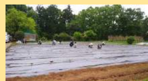
ひとつねごとに種まき。 人の手で、やさしく。