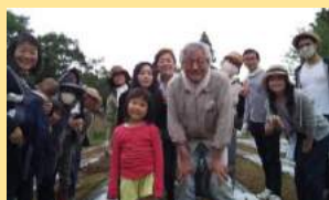
作業終了後、 全員での記念撮影。 ご参加いただき ありがとうございました!

参加者の皆さまからのご協力をいただき、 素晴らしいチームワークで一日で無事終了。 生成綿、茶綿、緑綿の三種類がまき終わりました。 秋の収穫が楽しみです。自然に感謝!