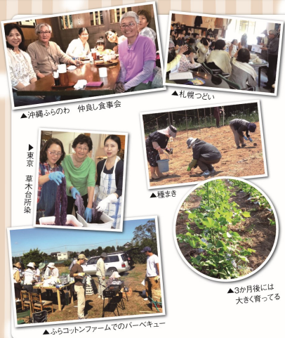
▲沖繩ふらのわ 仲良し食事会

従来開催していたイベントに加えて、新しいイベントの開催も企画しています。例えば、糸を紡ぎながらお酒を飲んだり、ワークショップの開催など、会員の皆さんと一緒に楽しめる企画を考えていますので、ぜひ創刊号をお楽しみに。