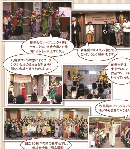
新年会のオープニングを晴れやかに彩る、宮武会員とお仲間による「南京玉すだれ」。