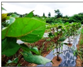
貴重な緑綿 栽培が難しいですが本年度は今のところ順調 約50cmに成長してきました

緑綿のオーナーになっていただく「 緑綿のトラスト 」。一口5千円の登録料で5本の緑綿のオーナーになると、収穫時にそ