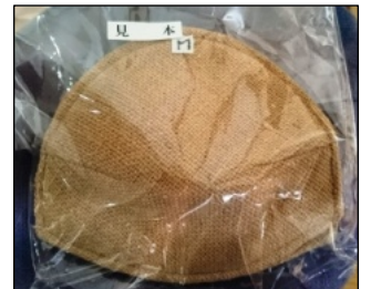
人気のマリムーンパット