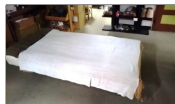
マリムーンロング