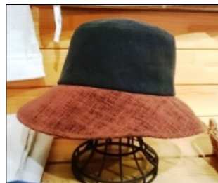
ふらツートンハット