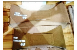
マリムーンコルセット